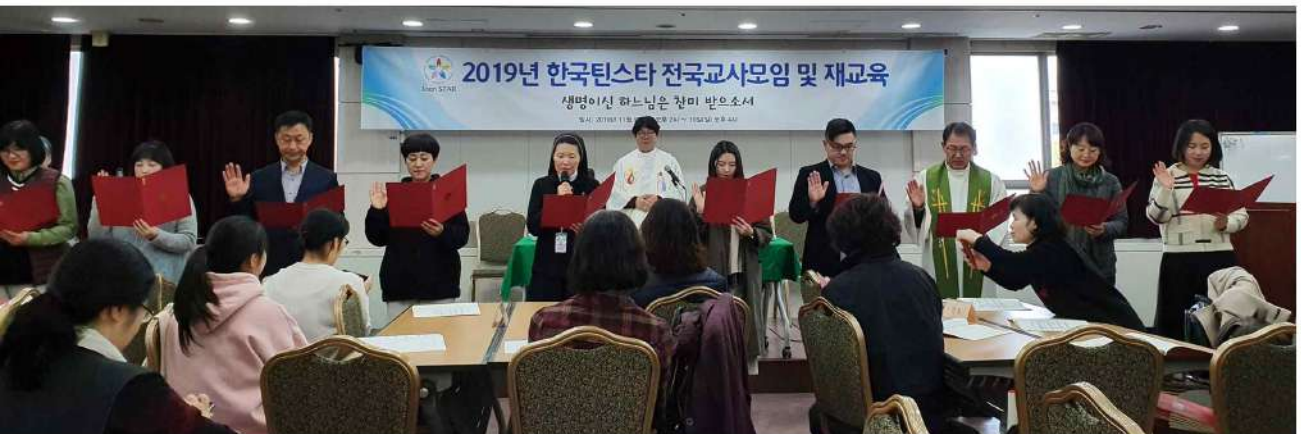
▼ 파견미사: 정교사 자격증 취득 후 선서를 하는 틴스타 교사