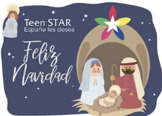
스페인틴스타에서 보내온 성탄인사입니다.