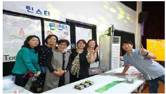
대구 교리교사의 날 틴스타 홍보