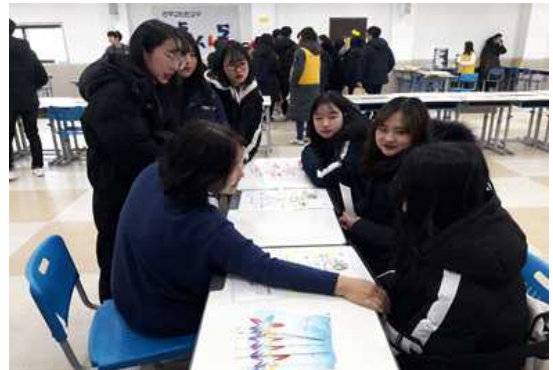
인천 바다의별 청소년축제 틴스타 홍보