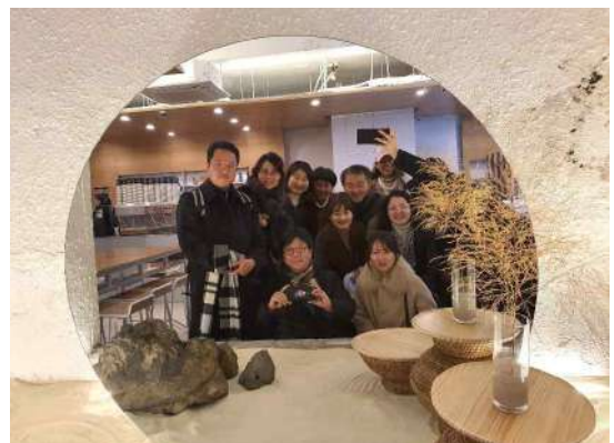
서울 교사 송년모임