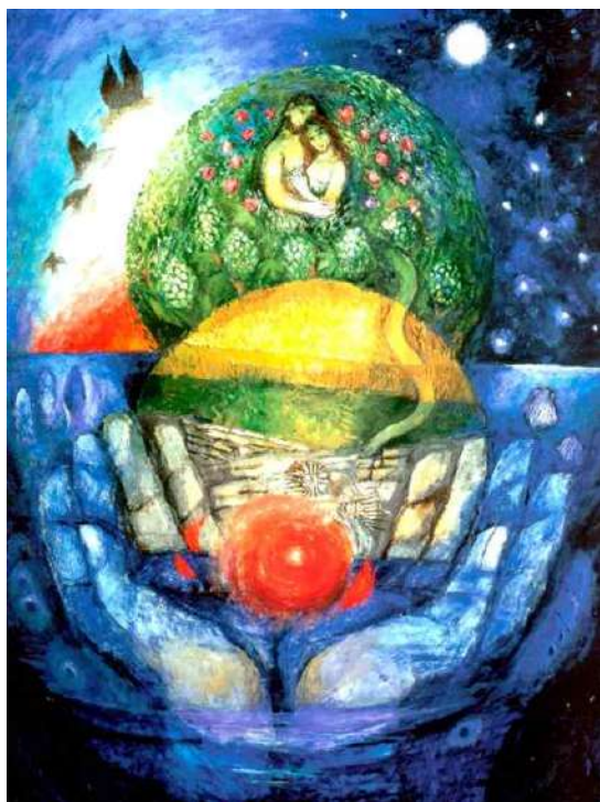
▲지거 괴더, '하느님께서 보시니 참 좋았다'

하느님이 거저 주신 모든 피조물들 가운데에서 아담이 체험한 고독은 인간 실존에서 비롯된 하느님께 대한 갈망의 표현입니다. 몸을 통해 자신이 다른 생물들과 같아질 수 없는 유일하고 고유한 존재임을 인식하며 사람은 하느님을 향해 열리게 됩니다. 동시에 이 고독은 '자기에게 알맞은 협력자'로 정의되는 다른 인격의 부재를 가리킵니다.