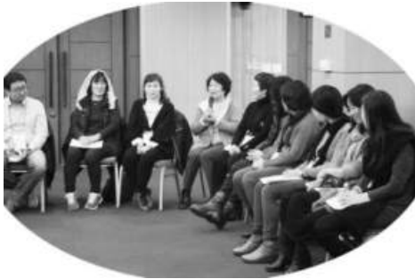
전국교사모임 참가 소감