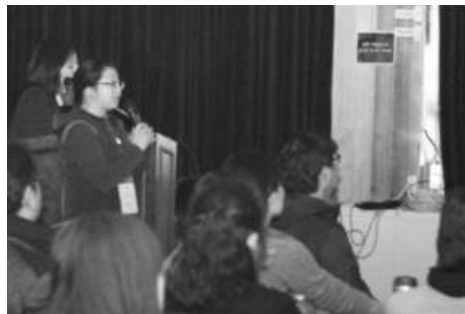
한국틴스타의 미래를 위한 생각을 모아... - 조직진단 컨설팅과 나눔 -