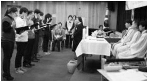
2014년 정교사 자격증 수여 ♥ 축하합니다 ♥