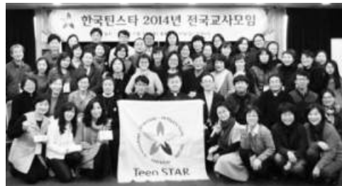
한국틴스타 2014년 전국교사모임