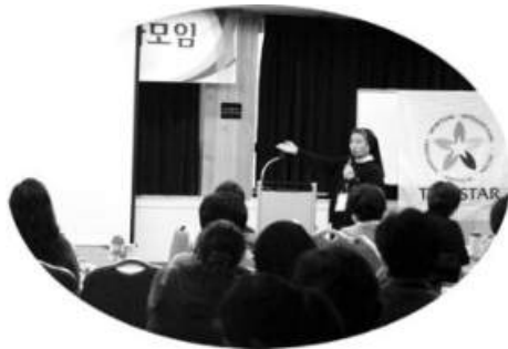
국제틴스타 회의 참가보고