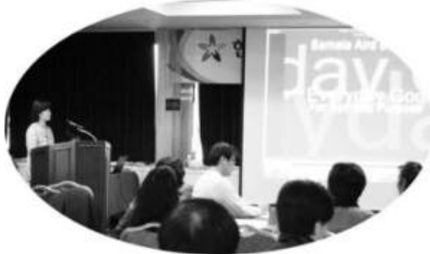
시작기도와 함께 Everyday God