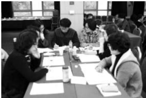
“우리 함께 생각해 봐요” 그룹 나눔