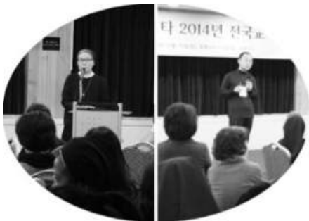
생명 · 사랑을 위한 홀로 그리고 함께!