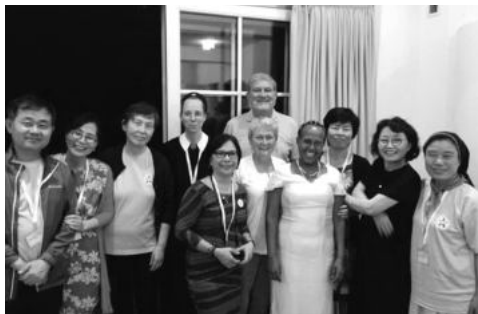
한국 팀과 함께한 미국, 필리핀, 우간다, 독일 참가자들