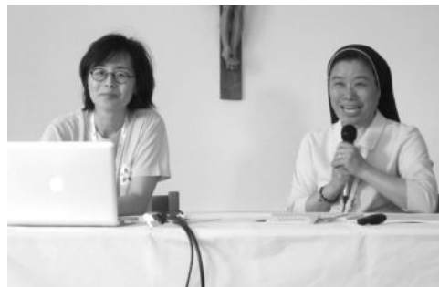
다른 참가국들의 응원와 지대한 관심을 받은 한국 틴스타