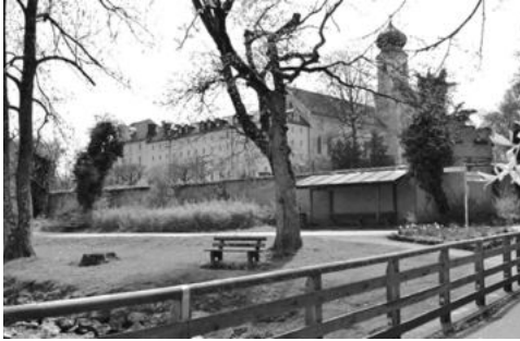
국제 모임이 열렸던 St.Martin 피정센터-Bernried, 독일