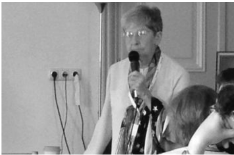
“오랜 친구와, 새로운 친구와의 만남이 반갑습니다.” - 한나수녀님