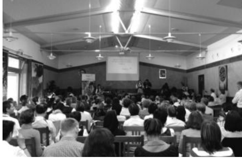
더 많은 독일 교사와 오스트리아 교사의 합류로 한층 고조된 강연 분위기