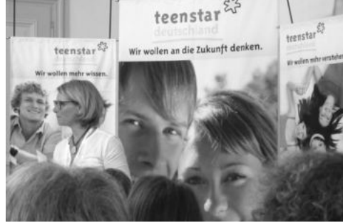
국제 틴스타 참가자들을 환영하는 독일 틴스타의 현수막