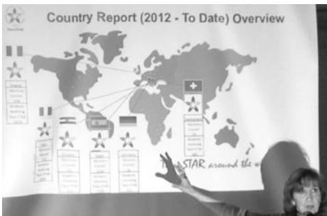
국가별 활동 보고의 시작 - Dr.필라