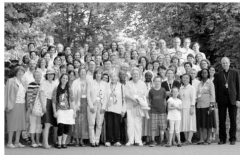
2016년 제9차 국제모임을 기약하며... 다함께 활짝! ^^