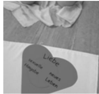
작업으로 풀어본 자연 출산 조절과 인공 피임의 비교 - 엘리자베스 (독일 대표)