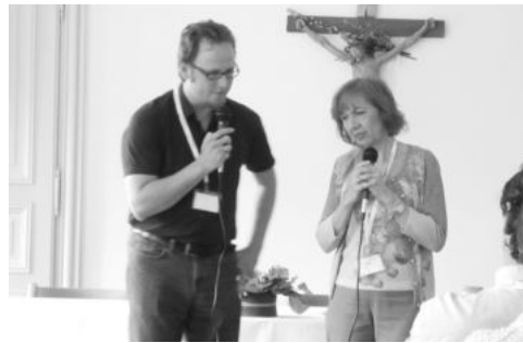
현 국제틴스타 대표 Dr.필라의 개회사