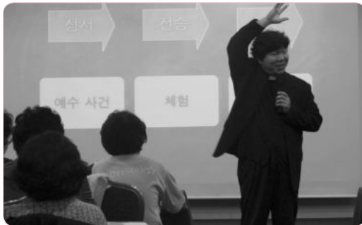
작업으로 풀어본 몸의 신학