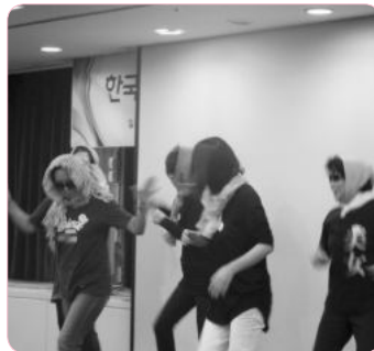
에너지 넘쳐나는 댄스~댄스~ 인천팀