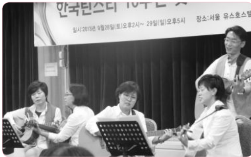
놀라운 기타연주 솜씨 "☆이 되리라" 서울팀