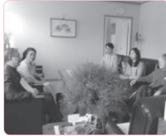
광주대교구 김희중 대주교와의 만남