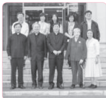
대구대교구 조환길 대주교와의 만남