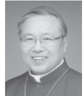
염수정 대주교 / 천주교 서울대교구장

한국틴스타 가족 여러분 안녕하십니까? 주님께서 틴스타 가족 여러분을 정말 사랑하십니다.