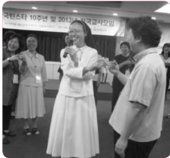
느낌 아니까~ “나는 당신을 믿어요.”