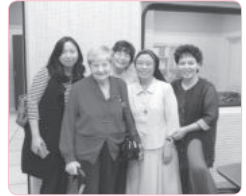
광주 평화방송라디오 인터뷰 - 틴스타 소개