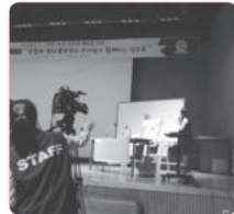
800여명의 신성여고 학생들을 위한 틴스타 소개특강