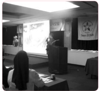
콘돔 광고의 실태와 문제 제기