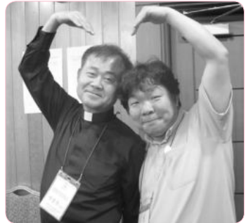
우리서로 사랑하게 해주세요~♡