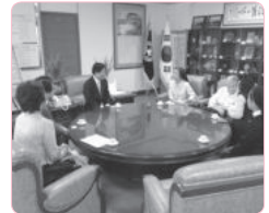
제주 양성언 교육감과의 만남