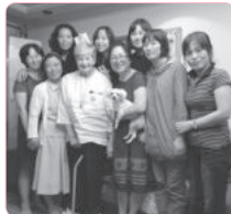
제주 교사들의 재결속을 다진 저녁모임