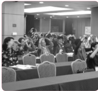
앞으로~♪ 앞으로~♪ 앞으로~♪ 앞으로~♪