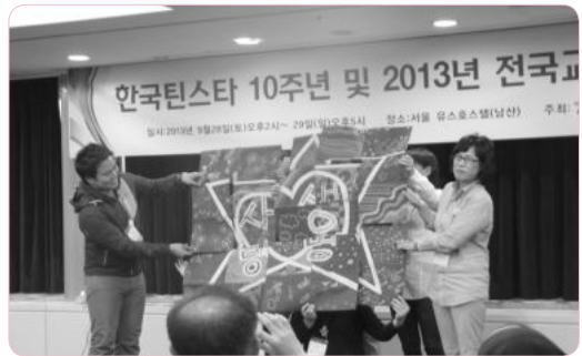
열정으로 똘똘 뭉친 대구팀