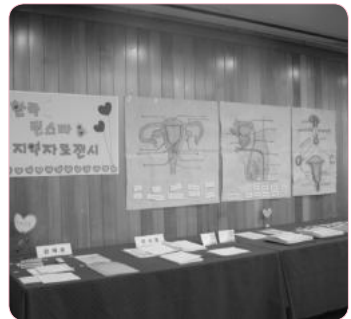
인기 만점! 자료전시