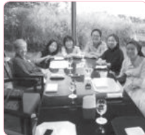
제주 코디의 아심찬 준비로 시작한 제주일정