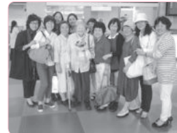
교사들의 열렬한 환영으로 시작된 대구 일정