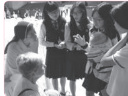
특강 뒤에 이어진 여학생들의 질문~질문~질문~