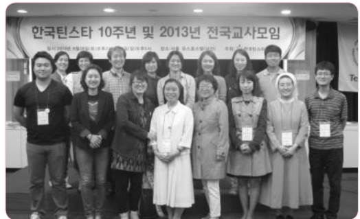
2013년 새내기 정교사들 짜짜짜~!!