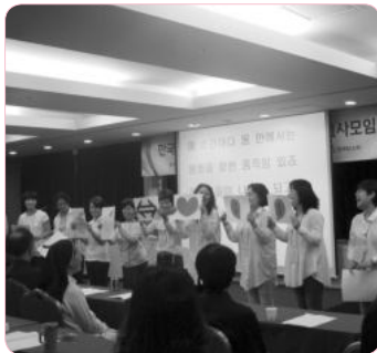
아이디어 톡톡!!! 광주팀