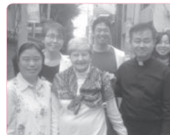
출국 전 착한목자 수녀회 바자회에서