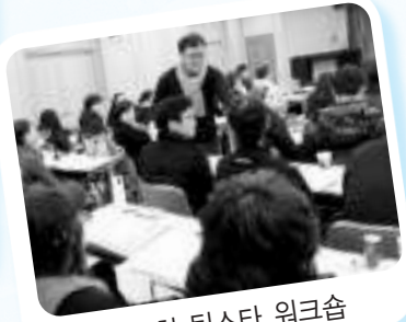
99차 틴스타 워크숍