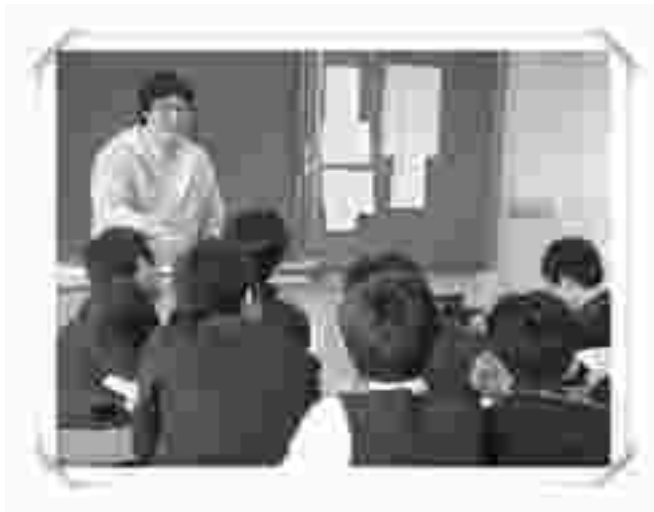
〈틴스타 프로그램에 참여하고 있는 사랑스런 학생들〉